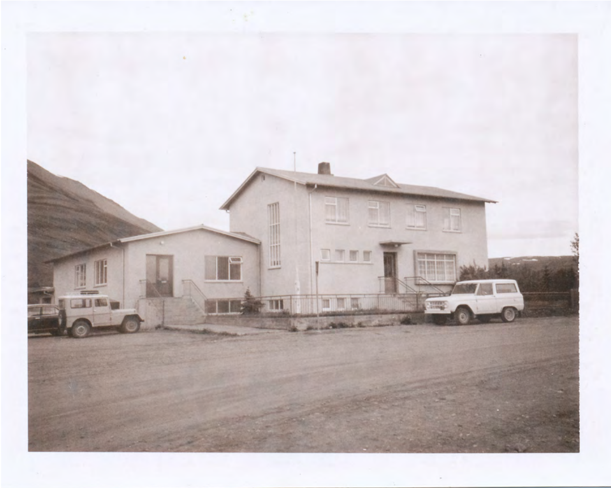
Mynd 7: Tún - Miðgarður 4. Tekin 1975