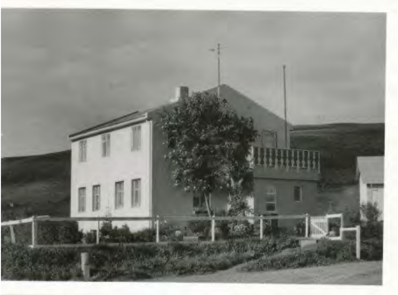
Mynd 4: Borgarhóll árið 1975