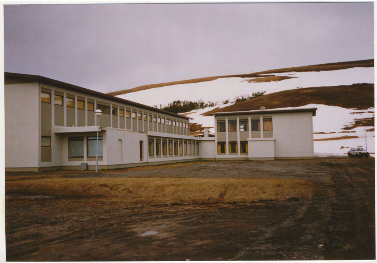
Mynd 9: Framhaldsskólinn á Húsavík - byggt sem Gagnfræðiskólinn. Tekin 1989.

Byggingin sem í dag hýsir Framhaldsskólann á Húsavík var upprunalega byggð sérstaklega undir starfsemi Gagnfræðaskólans á Húsavík. Tekin var ákvörðun um að byggja hús fyrir Gagnfræðaskólann þegar barnaskólabyggingin var orðin of lítil fyrir bæði námsstigin en einnig höfðu verið starfræktar framhaldsdeildir í Gagnfræðaskólanum. Verkefninu var skipt í tvo áfanga, byrjað var á fyrri hlutanum árið 1969 og hófst kennsla í honum árið 1972. 25 Bygging seinni áfanga, ein hæð og kjallari, hófst árið 1975 og var sú álma tekin í notkun 1977. Kjallarinn var meðal annars notaður fyrir kennslu í sjóvinnu og leirbrennslu en einnig var þar aðstaða til líkamsræktar sem notuð var af íþróttafélaginu Völsungi auk almennings. Ekki hafa verið gerðar neinar viðbyggingar eða meiriháttar breytingar á húsnæðinu síðan það var fullklárað. 26