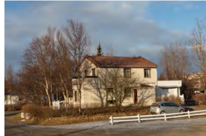
2023 - Gaukur Hjartarsson