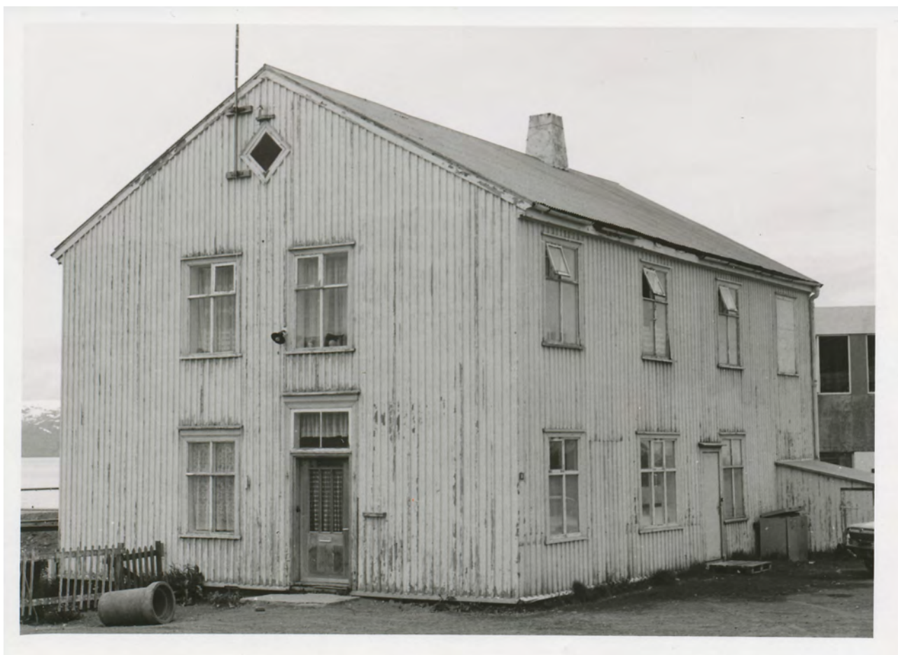
Mynd 5: Garðarshólmi um 1975, þá staðsett að Garðarsbraut 16

Húsið Garðarshólmi, sem einnig er kallað Guðjónsenshús/Faktorshús, stendur nú við Stóragarð 4 við hlið Gamla Skóla. Húsið er elsta húsið á Húsavík og er timburhús sem upphaflega var byggt á svæðinu Búðarvellir, einnig kallað Öskjureitur, á vegum Ørum og Wullfs fyrir verslunarstjórnann árið 1880. Húsið var nýtt undir margskonar aðra starfsemi á