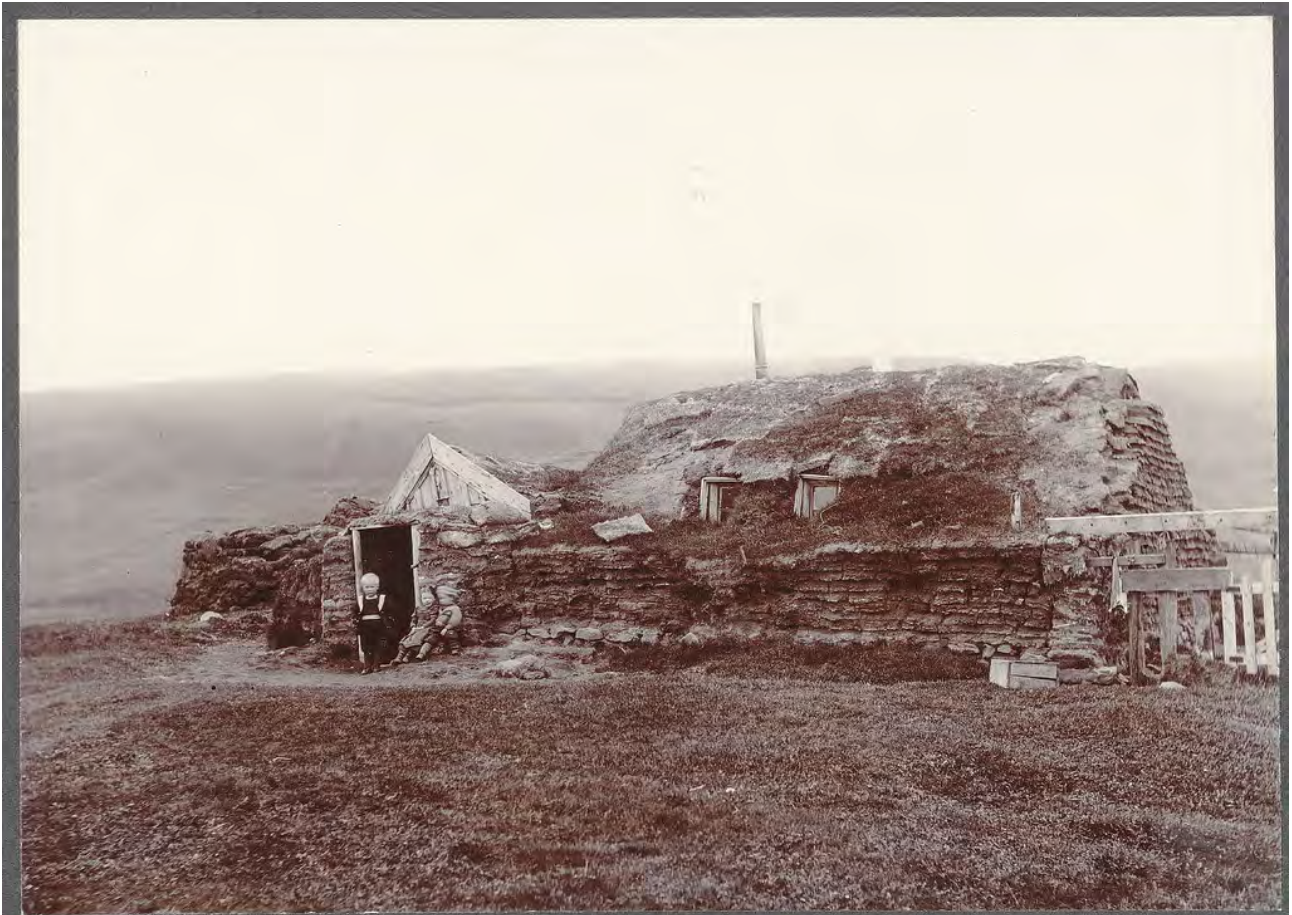
Mynd 2: Gamli Borgarhólsbærinn, torfbær sem stóð á lóðinni sem núna er Borgarhólsskóli. Tekin um 1900

Á miðju svæðinu, vestanmegin, eru bílastæði fyrir starfseminu í kring og útileiksvæði barnaskólans með sparkvöllum og öðrum leiktækjum. Austan og sunnanmegin við skólann er grænt svæði sem tilheyrir skólanum og nýtist sem útivistarsvæði fyrir nemendur hans.