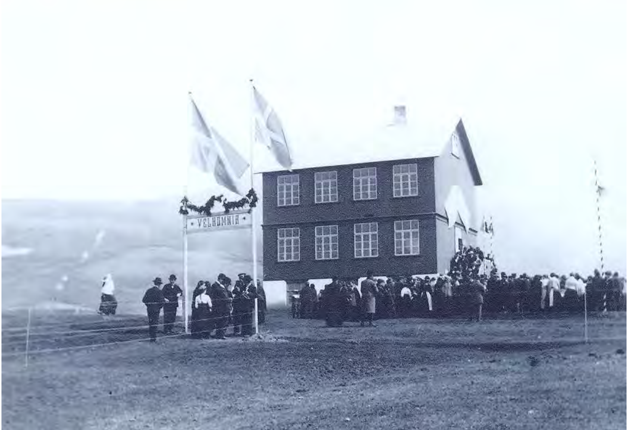
Mynd 6: Gamli barnaskólinn. Tekin 17.júni 1911