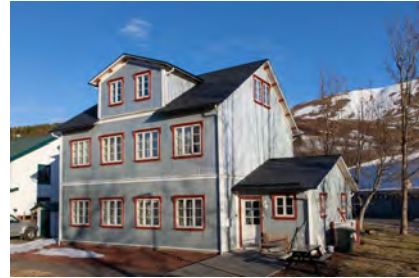
2023 - Gaukur Hjartarson