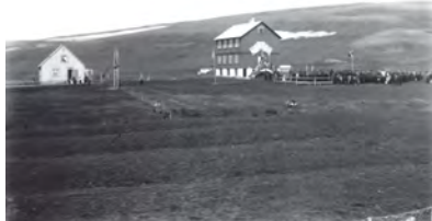
1908 vinstra megin - Héraðskjallasafn Þing

Upphafleg notkun: Íbúð Núverandi notkun: Íbúð