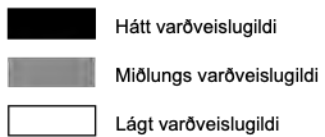
Kort 3: Varðveislumat húsa og mannvirkja