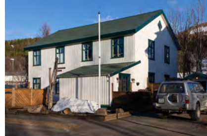
2023 -Gaukur Hjartarson