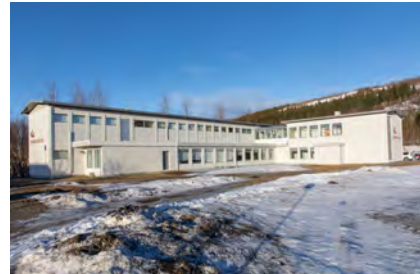
2023 - Gaukur Hjartarson