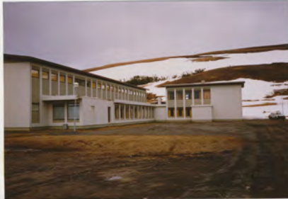
1989 - Héraðsskjalasafn Þingeyinga

Upphafleg notkun: Skóli Núverandi notkun: Skóli