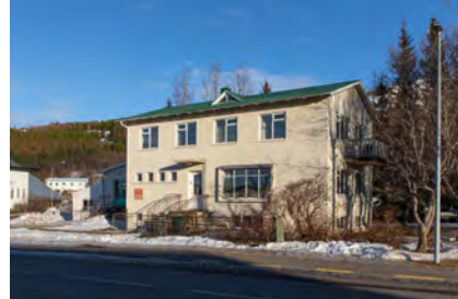
2023 - Gaukur Hjartarson