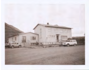
1975 - Héraðsskjalasafn Þingeyinga

Upphafleg notkun: Íbúð; Þjónusta Núverandi notkun: Þjónusta