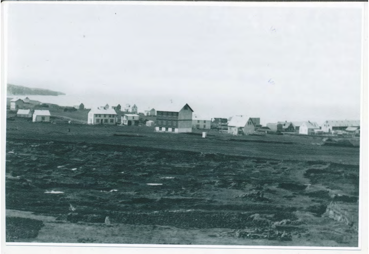
Mynd 1: Tekin um 1910. Gamli Skólinn fyrir miðri mynd og Borgarhóll hægra megin við hann

Unnið að beiðni Skipulags- og byggingarnefndar Norðurljósa 2022-23.