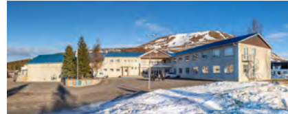
2023 - Gaukur Hjartarson