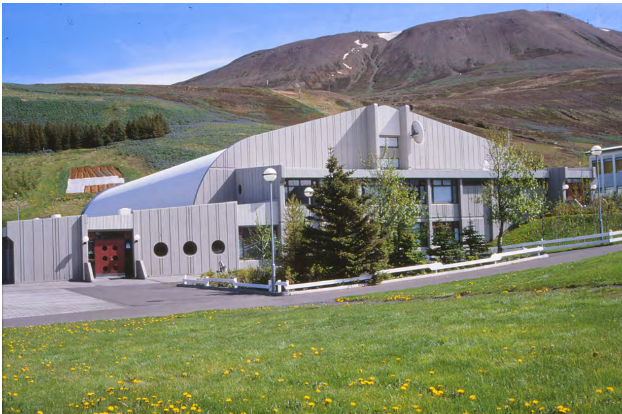
Mynd 10: Íþróttahöllin á Húsavík. Tekin 2000.