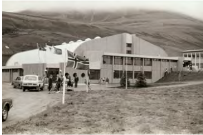
1987 - Héraðsskjalasafn Þingeyinga

Upphafleg notkun: Menningarstarfsemi; Þjónusta Núverandi notkun: Menningarstarfsemi; Þjónusta