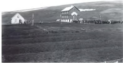
1908 - Héraðskjalasafn Þingeyinga

Upphafleg notkun: Skóli Núverandi notkun: Íbúð