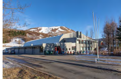
2023 - Gaukur Hjartarson