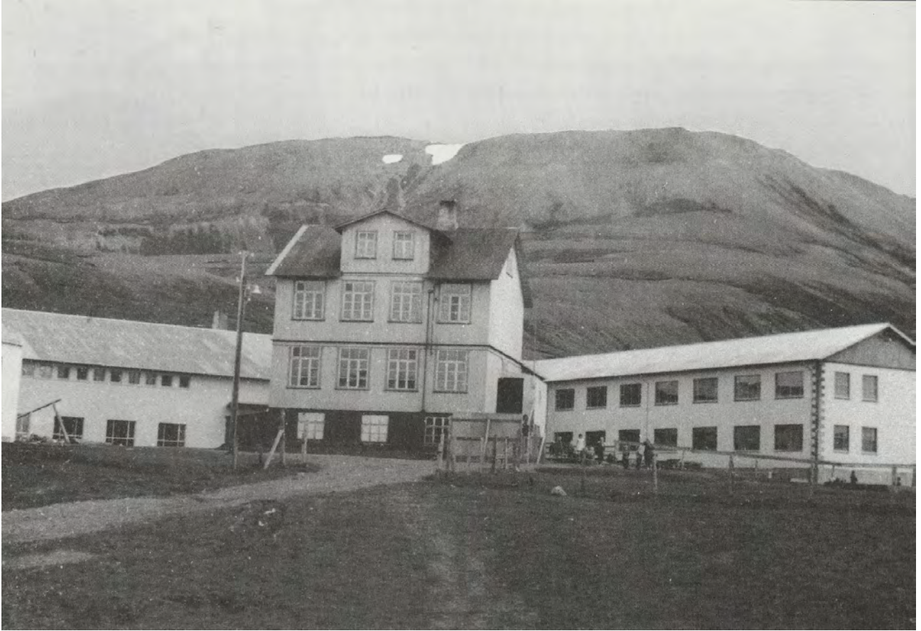
Mynd 3: Gamli Skólinn á upprunalegri staðsetningu með nýja barnaskólann fyrir aftan. Gamla skólabyggingin var síðan flutt að Stóragarði 6