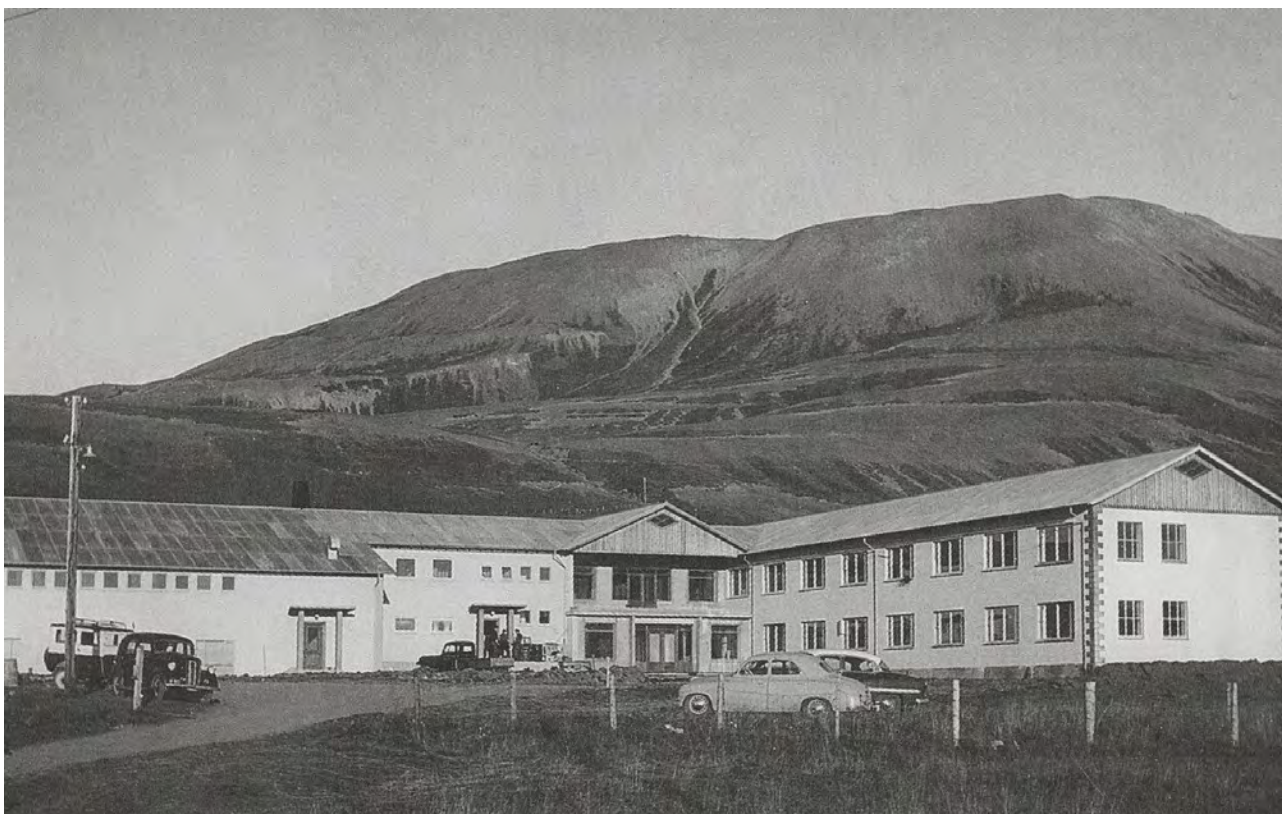
Mynd 8: Barnaskólinn á Húsavík