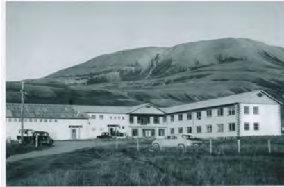
Ártal ekki vitað - Héraðsskjalasafn Þingeyinga

Upphafleg notkun: Þjónusta Núverandi notkun: Skóli