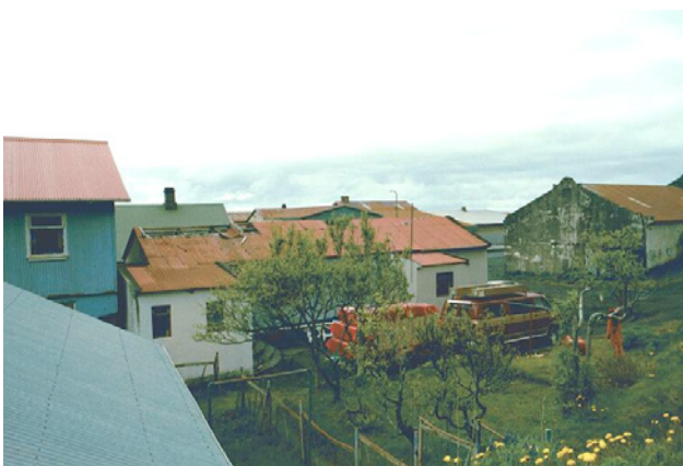
6.júní 1999 úr norðri