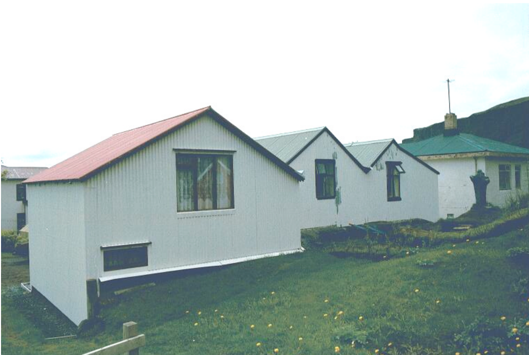
Engigarður t.v. Hjalli t.hægri. Séð ofan úr brekkunni.