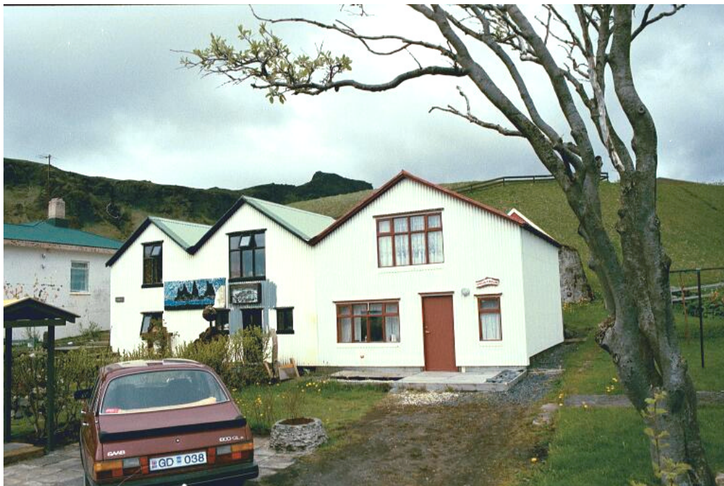
Hjalli (tvær burstir) til vinstri Engigarður til hægri. Séð úr suðri.