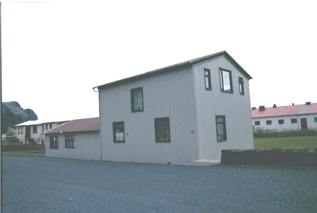
Íbúðarhúsið frá Mið-Hvoli nr.11 A t.v. Sölubúð KS nr.11 til hægri.