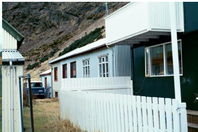
8.nóvember 2002 úr suðaustri, húsið næst elsti Lundur