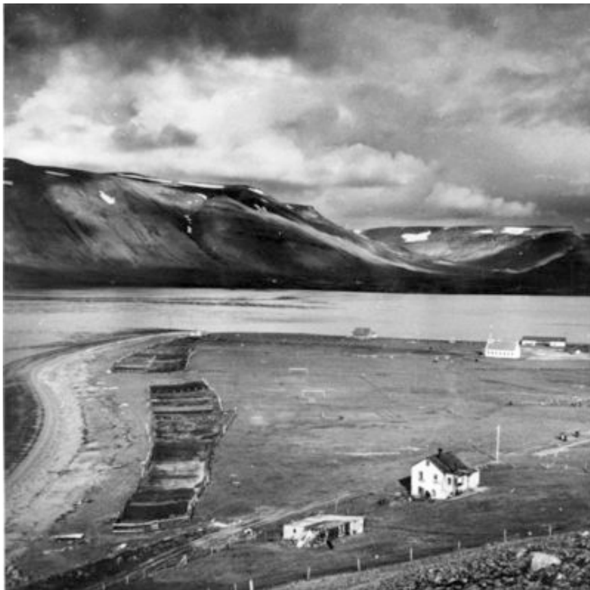
Byggðarendi, nú Aðalstæti 55 - mynd frá um 1930

Hafnarstræti byggist samsíða flutningsleið saltfisksins frá þurrkreitunum að Gramsverslun og Salthúsinu, og áfram að Balanum. Við Hafnarstræti standa mörg merk gömul hús, sum friðuð, sem eru ómetanleg fyrir atvinnu og byggingarsögu okkar.