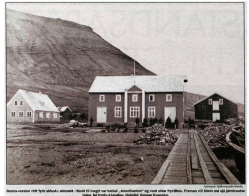
Grams-verslun vitti fyrir síðustu aldamót. Húsið til hægri var kallað „Amerikahúsið“ og varð stólar fyrirhúsið. Framman sést húsið með eigið járnstráubelstu, þá fyrstu á landinu. Hólmvíki: Gunnar Sveinsson.