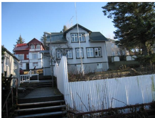
Horft í austur, bakhlið.