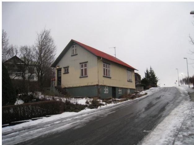
Horft í suður.