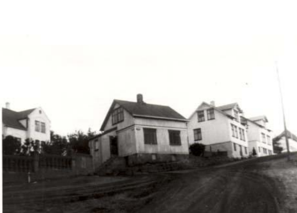
Húsið sem er fremmst á myndinn er Suðurgata 29 en það hús er horfið í dag en hin húsin eru Suðurgata 31 og 33 standa enn, einnig sést í gaflinn á Gíslabúð. Lengst til vinstri er Hliðabraut 2.