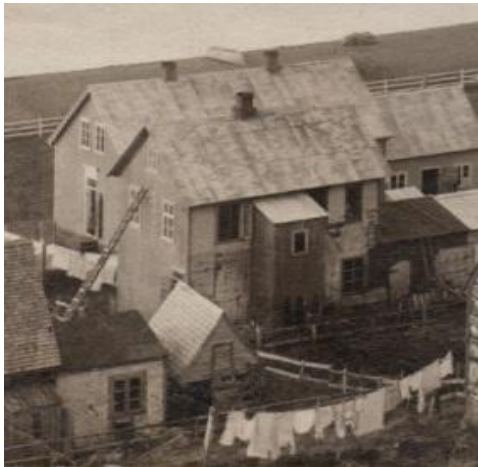
Horft til norðurs.