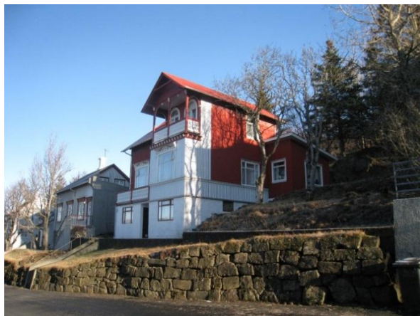
Horft í austur.