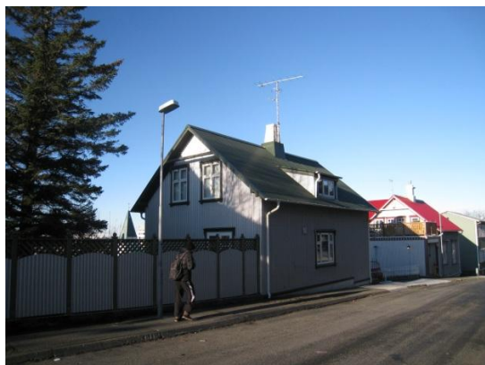
Horft í norður, götuhlið.