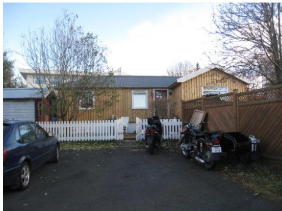
Horft í suður.