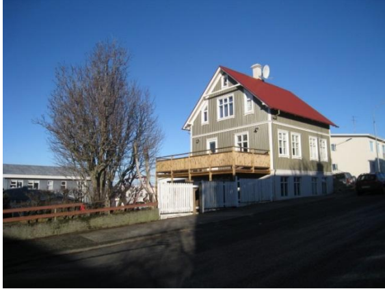
Horft í norður