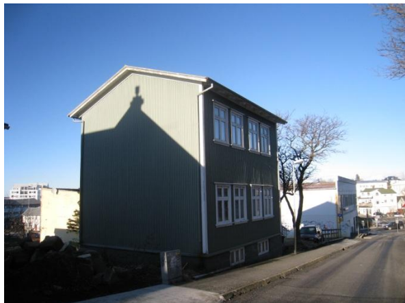
Horft í norður.