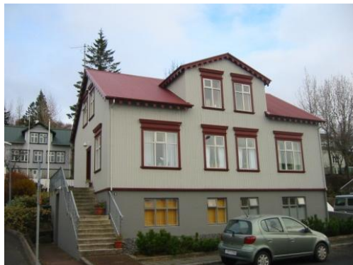
Sýslumannshúsið við Suðurgötu 11. Horft í norður.