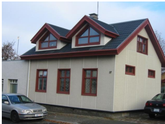
Horft í norðaustur.