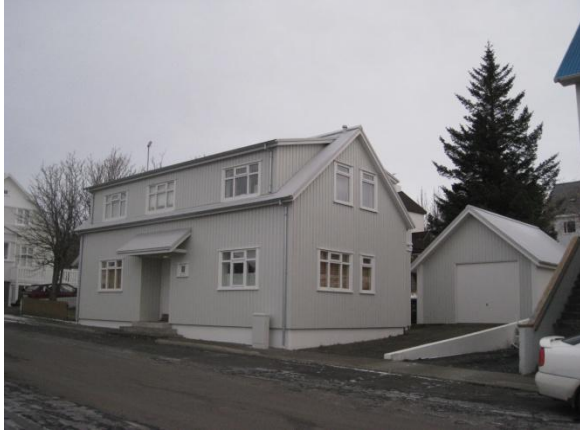
Horft í norðaustur.