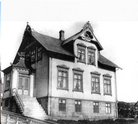
Horft til suðausturs.