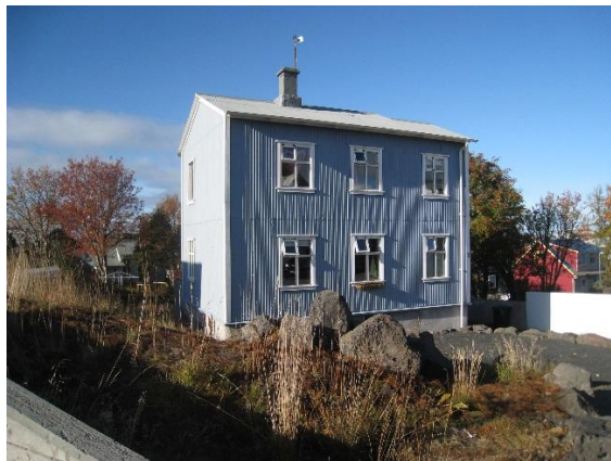
Horft í vestur.