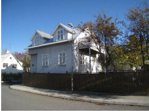
Horft í norðaustur.