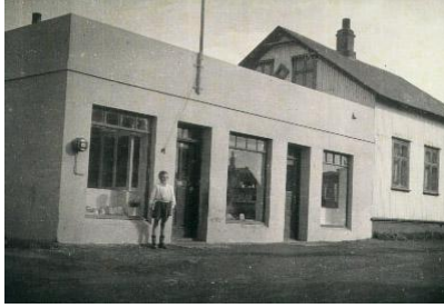
Horft í suðsuðvestur.