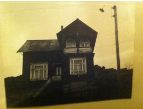
Horft í auðsuðaustur.