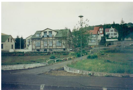
Sýslumannshúsið þegar að stóð við Suðurgötu 8. Horft í austur.