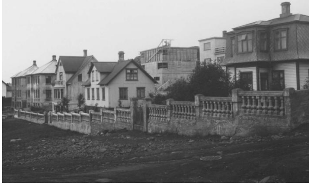
Horft í norður, eftir Suðurgötunni eftir 1931.