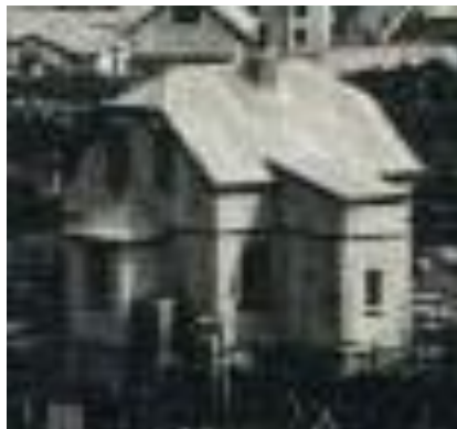
Bakhlið, horft til vesturs ljósmynd frá 1912.