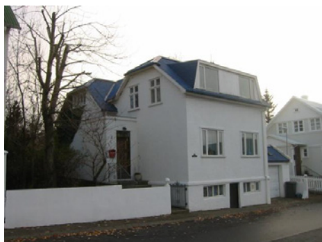
Framhlið. Horft til suðurs.