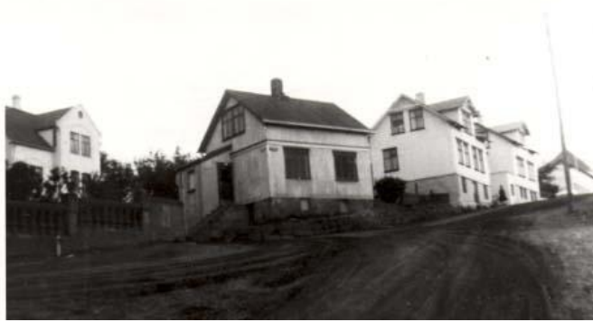
Horft í suður. Húsið sem er fremmst á myndinn er Suðurgata 29 en það húsi er horfið í dag en hin húsin eru Suðurgata 31 og 33 standa enn, einnig sést í gaflinn á Gíslabúð. Lengst til vinstri er Hliðabraut 2.