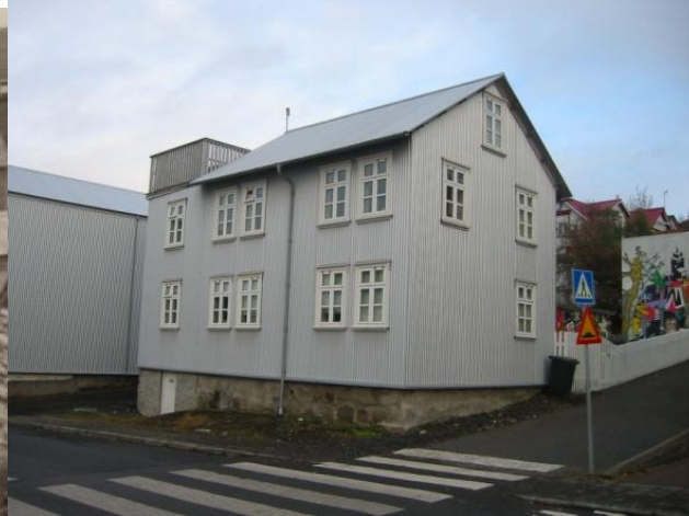
Horft til austurs.