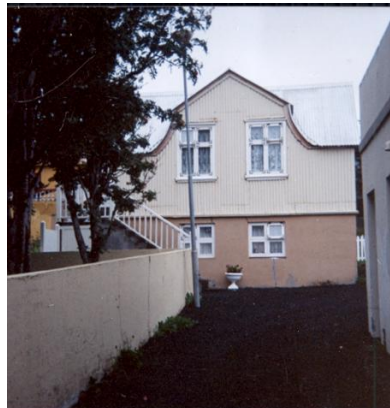
Suðurgata 35b, mynd frá 1991. Horft í suður.