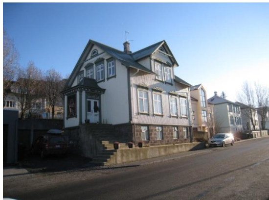
Horft til suðausturs.