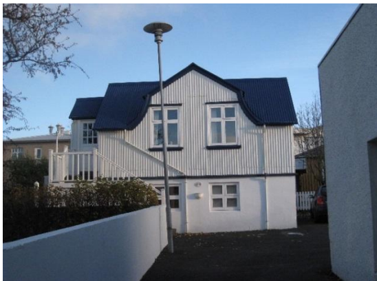
Suðurgata 35b, mynd 2012. Horft í suður.