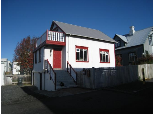
Horft í suð suðaustur.