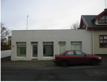
Horft í suður.