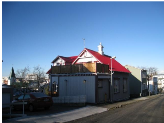
Horft í norður.