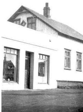
Horft í suðsuðvestur.