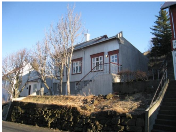
Horft í austur.