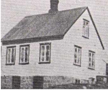
Horft í austur.