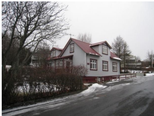
Horft í suður.